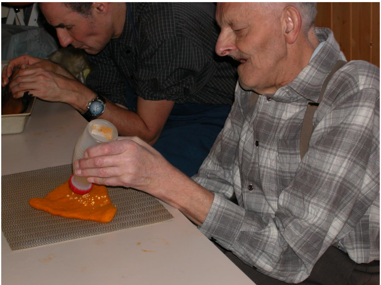
Egidius (und Egidio)