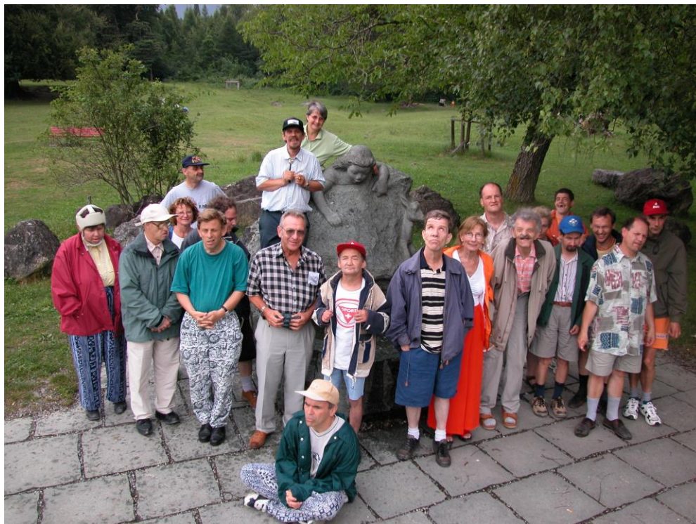
Zur Belohnung für fleißiges Arbeiten durften die «Wollarbeiter» jährlich einen Atelierausflug genießen, z.B. hier am 24.6.2002 bei einem Zwischenstop vor dem «Heidibrunnen» in Maienfeld. Zuvor wurde die Taminaschlucht besucht und im Alten Bad Pfäfers das Mittagessen eingenommen.