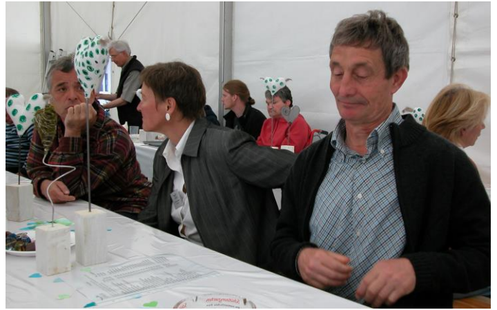
Musikgruppe «Na und!» aus Deutschland.